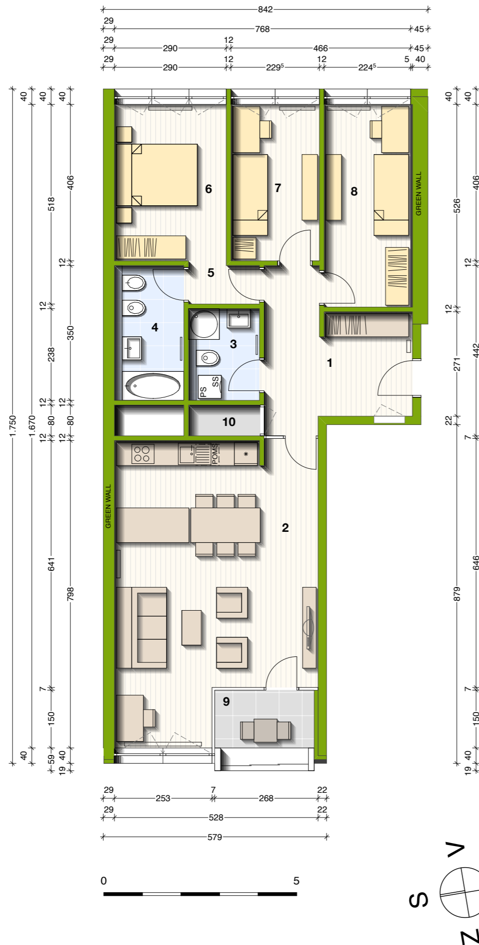
lega stanovanja v objektu - prerez

INFORMACIJE IN PRODAJA tel: 041 686 965 / 040 666 633 mail: prodaja@akropola.si www.ekosrebrnahisa.si